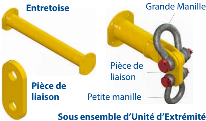
Tableau 1 - Composants