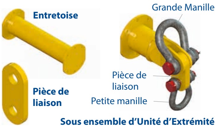
Tableau 1 - Composants