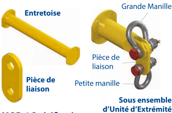
Tableau 1 - Composants