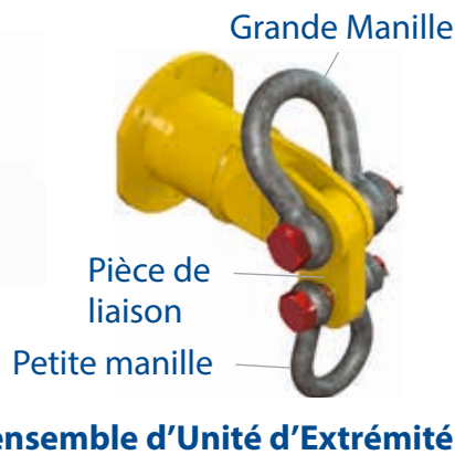
Tableau 1 - Composants