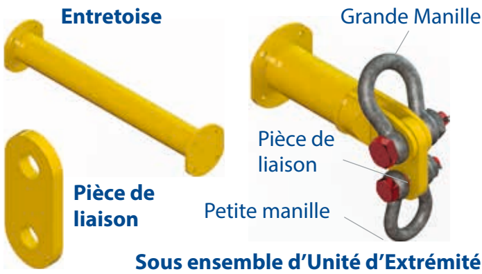
Tableau 1 - Composants